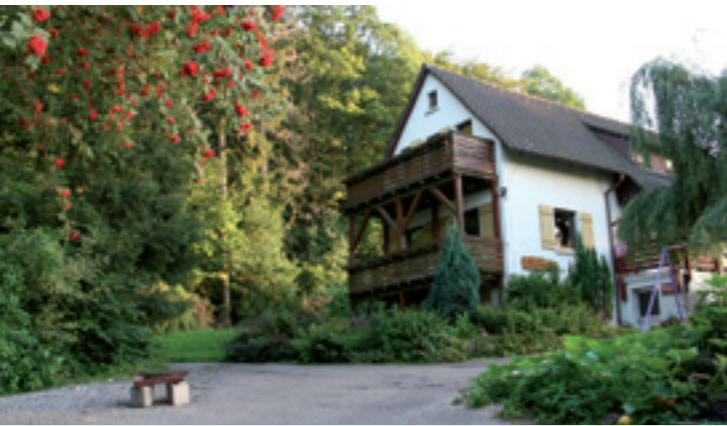
Das Waldhaus in ruhiger Lage am Waldrand