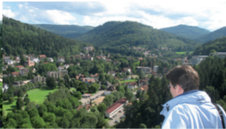
Blick vom Falkensteinfelsen auf Bad Herrenalb

Alle Gäste des Waldhauses sind herzlich zu den Andachten im Henhöferheim eingeladen.