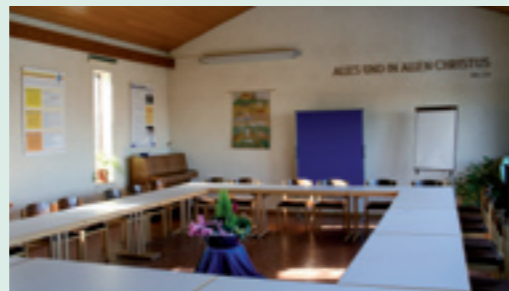
Der geräumige Friedrich-Hauß-Saal