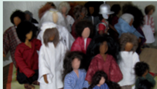
Biblische Erzählfiguren aus einem Bastel-Workshop